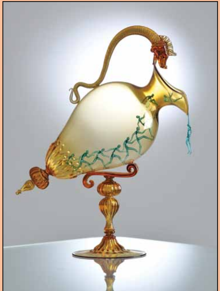
ANFORA 35 cm H, 35 cm W.