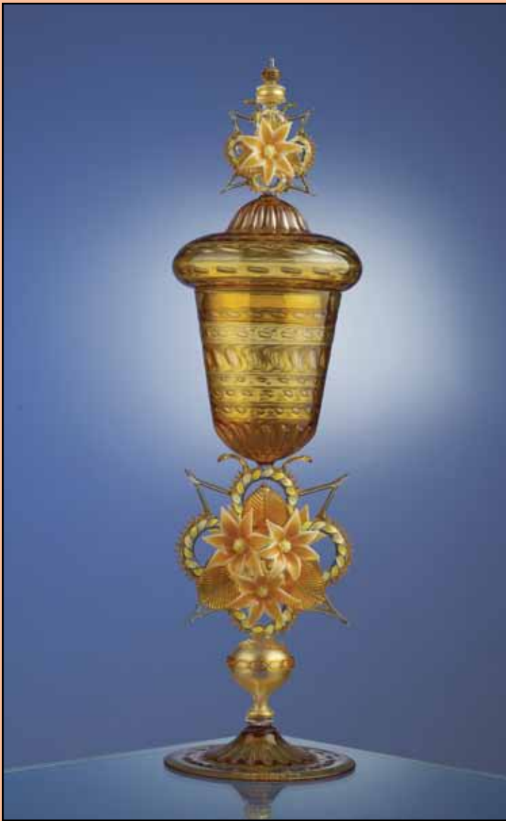
RELIQUIARIO 39 cm. H.