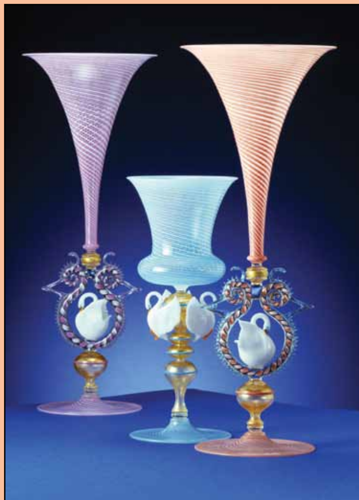
FILIGREE SWAN GOBLET 23 to 33 cm H.