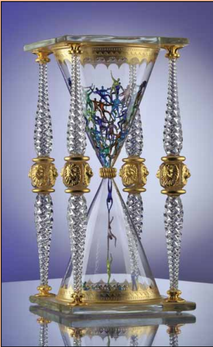
GRANELLI DI SABBIA 42,50 cm H.

Le fabbriche di Murano risalgono al XIII secolo e danno una nuova dimensione all'espressione "tradizione del vetro". Quando penso al vetro Veneziano, io penso al vetro commerciale ma sono ben consapevole dei capolavori creati da alcuni artigiani fra i più abili e qualificati del mondo. La tradizione Veneziana, dal mio punto di vista, ha avuto sfumature nel corso dei secoli