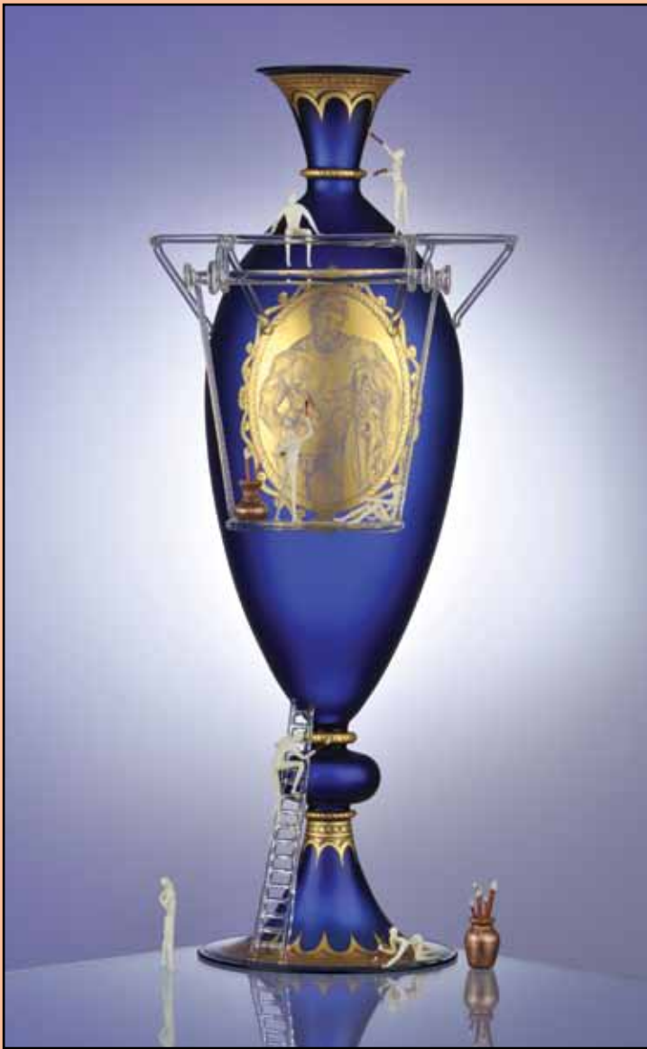
OPERA 41 cm H.

When comparing Césaire who is known for his Classical, Contemporary, and more experimental series share evidence of a mastery of process, which makes me proud of the field. They also share the same magic: originality, faithfulness to the material, and impeccable craftsmanship. The difference between Césaire's series is that the Classical and Contemporary focus the imagination within the tradition, while the others show a creative freedom and playfulness.