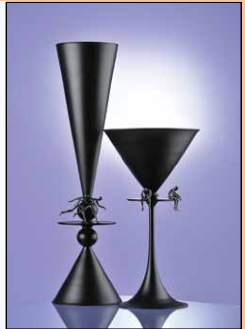
PICCOLI UOMINI 23,50 to 35 cm H.